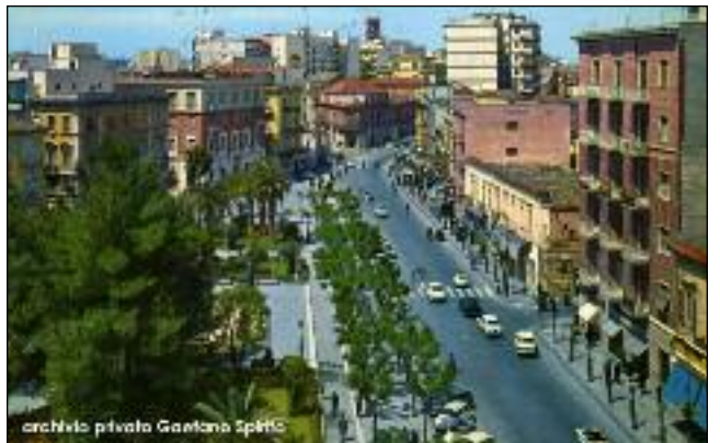
il parco negli anni '60