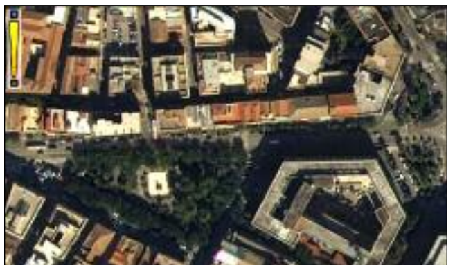
vista aerea prima dell'inizio dei lavori