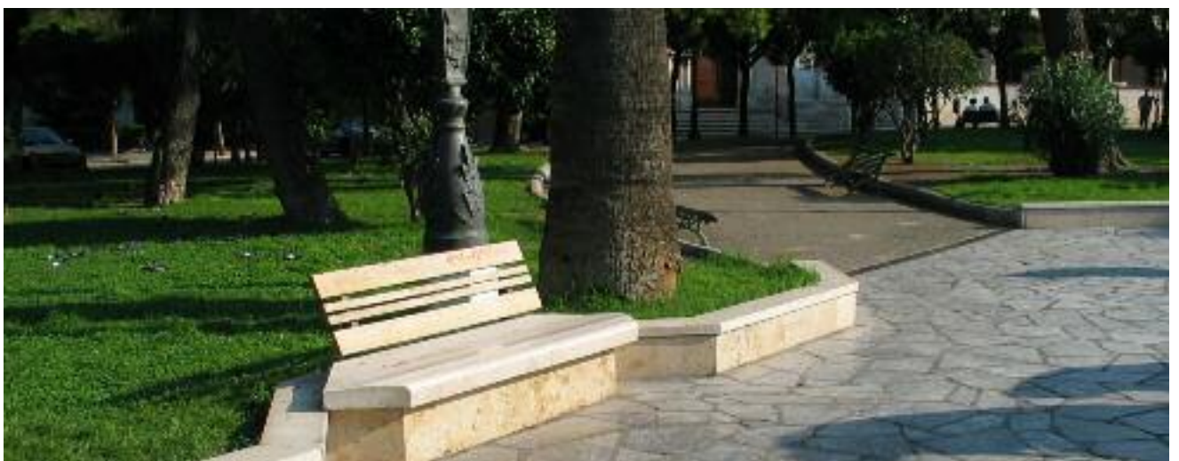
Dall'alto in basso: la situazione attuale, foto storica, la piazza nel settembre 2006