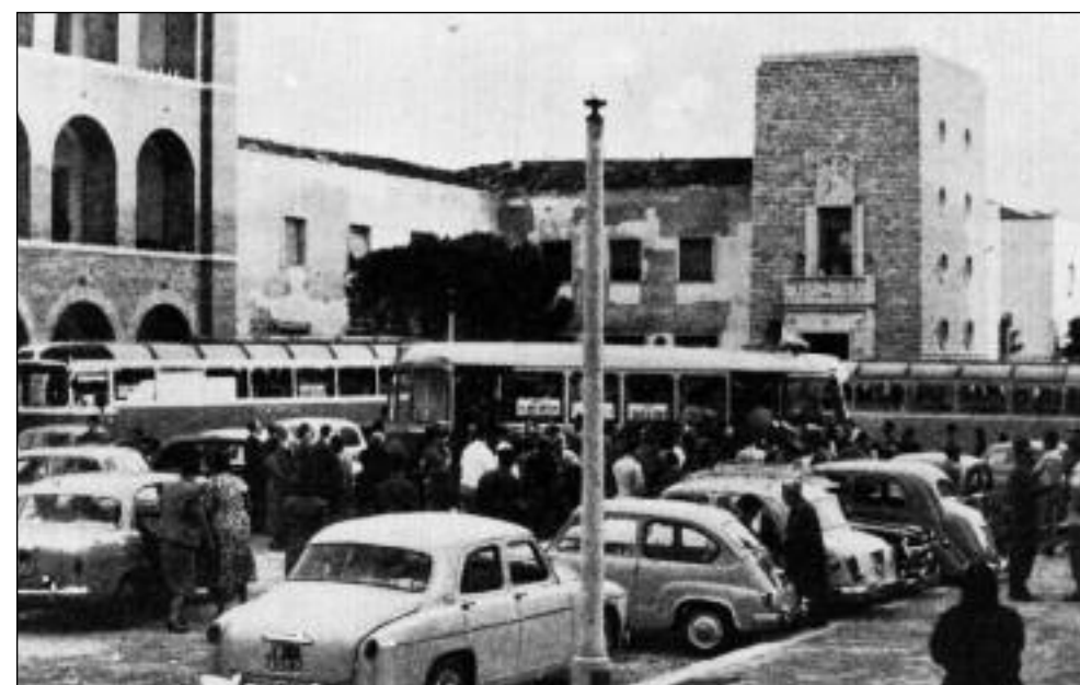
Borgo Segezia festa di piazza nel 29 settembre 1962

Il testo è tratto da: DAGOBERTO ORTENSÌ, Edilizia rurale , Editrice Mediterranea, Roma 1940