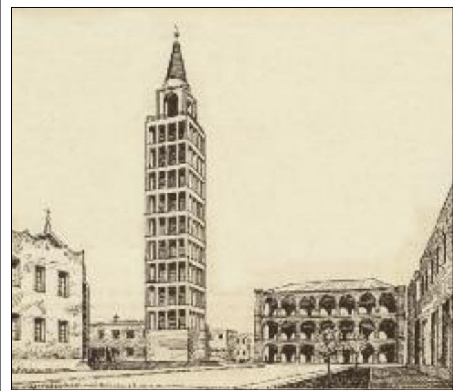
Il Campanile e il Comune, disegno di Dagoberto Ortensi

za minima di 6 metri, che, agguantata ai rispetti obbligatori per l'arretramento, danno sezioni