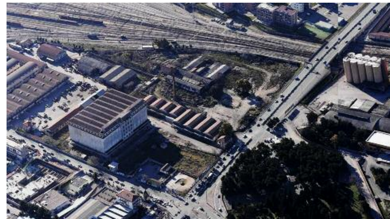
In alto: la foto aerea consente apprezzare meglio il contesto del silos e del consorzio agrario. La loro è una collocazione strategica sia per la vicinanza con la stazione ferroviaria sia per la contiguità con uno degli accessi più importanti alla città: via Manfredonia