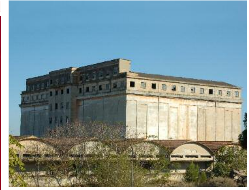
Un primo piano della più straordinaria architettura industriale di Foggia. Testimonianza del legame con l'agricoltura e monumento della considerazione di cui godeva la città a livello nazionale.