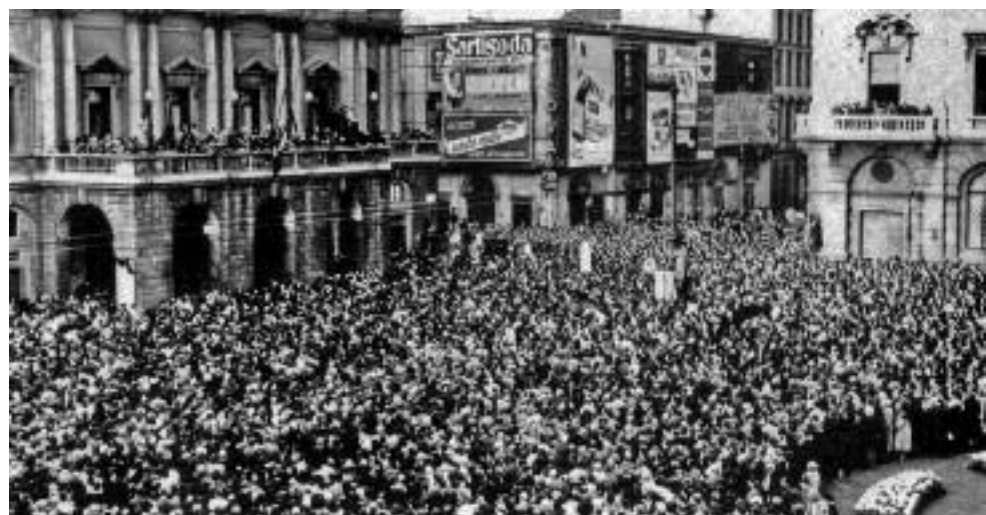
14 novembre 1948 - I funerali di Umberto Giordano a Milano