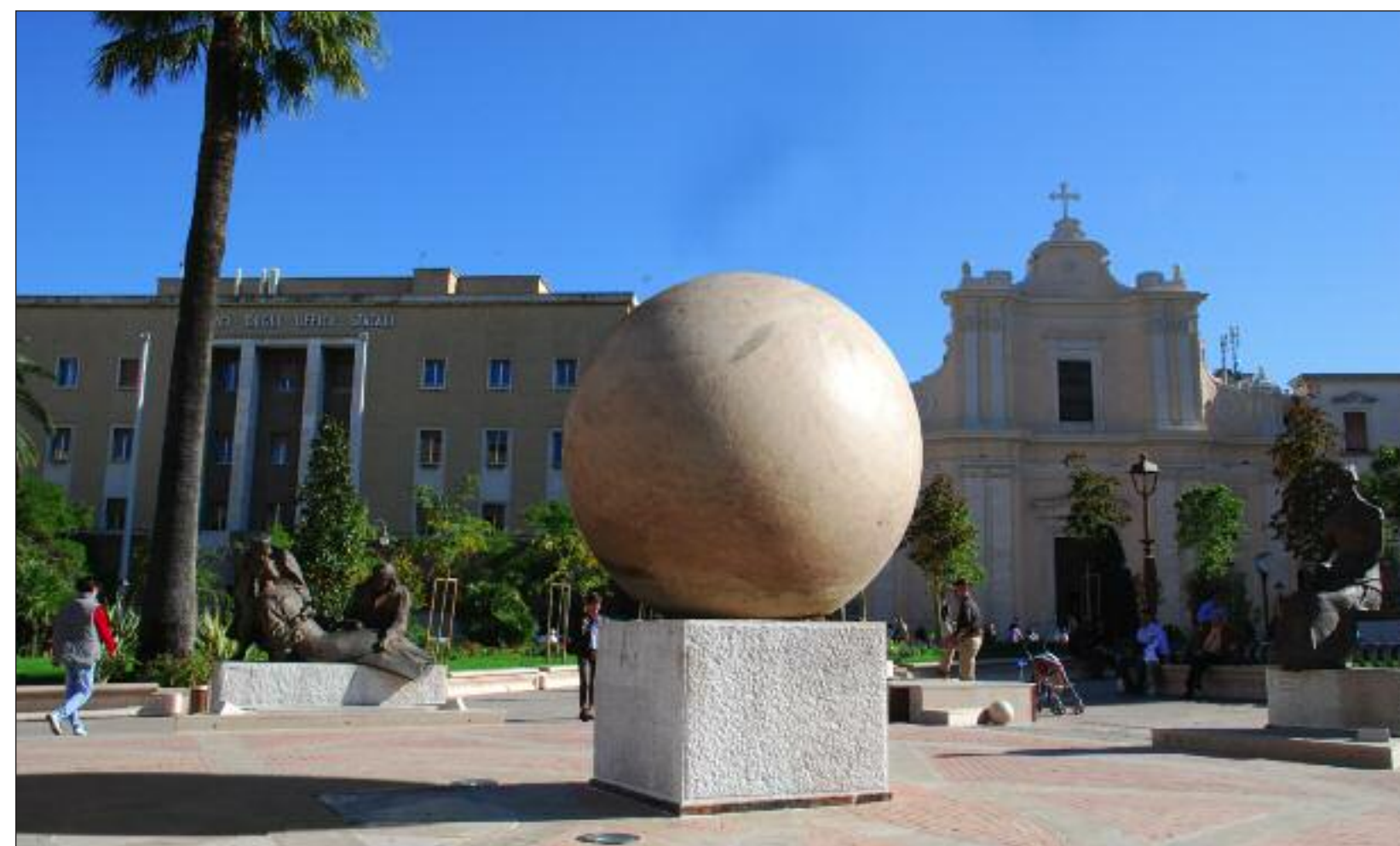
Lo sferoide disassato incubatore di innovazione architettonica opera di Achille Perito Oliva (ascolana) da Satriano sostituirà per sempre la statua di Umberto Giordano.

Achille Perito Oliva (Ascolana) da Satriano progetta il nuovo sferoide