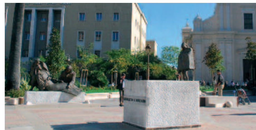
Ecco come si presentava la piazza prima dello straordinario intervento artistico nello spazio pubblico.