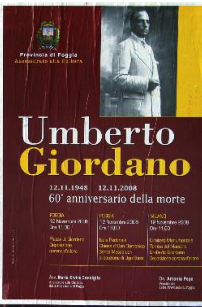
Ironia della sorte li hanno attaccati l'uno al fianco dell'altro: due storie molto differenti eppure tipicamente foggiane.