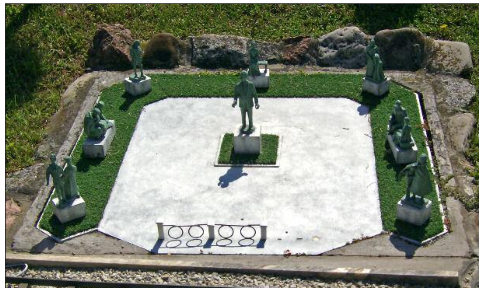
Rimini: Italia in Miniatura. Ecco dov'era il "nostro caro concittadino" fuggito per la terza volta da Foggia non per Foggia... Sarà la volta definitiva o tornerà?

APO: «La differenza sta nel fatto che io vengo pagato (profumatamente) e gli altri disquisiscono accademicamente. Si ricordi che una sfera fatta da lei è una palla, fatta da me è uno sferoide disassato incubatore di innovazione architettonica... e se mi ricordassi anche chi sto citando sarei più contento. Ma non fa niente: fino a quando ci sono i soldi c'è tutto».