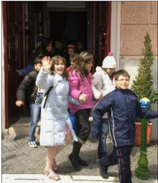
A centro pagina e qui in alto, gli alunni della Leopardi durante il dibattito ed all'uscita dalla Sala Farina.

L'ultimo appuntamento è firmato dal regista Carlo Lizzani, che con HOTEL MEINA, lungometraggio storico drammatico, tratto dal libro di Marco Nozza, racconta della strage di 54 ebrei sfollati dalle cittadine del Lago Maggiore da parte di una divisione SS di Hitler. Il film non a caso sarà programmato dal Falso Movimento nei giorni 24 e 25 APRILE festa nazionale in commemorazione della liberazione dal regime fascista, con spettacoli alle ore 20:00 - 22:00.