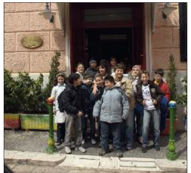
In alto, gli alunni all'ingresso del cinema. A sinistra e in basso, alcune sequenze particolarmente significative tratte dal film.