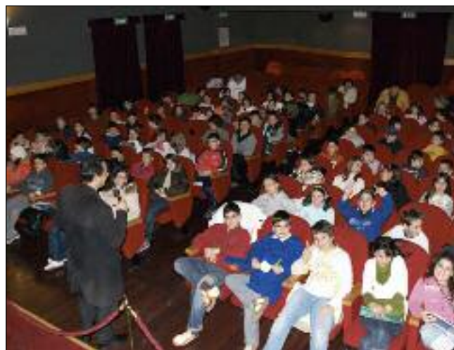
In alto, a sinistra il dibattito al termine della proiezione. A destra, i bambini delle quinte classi in attesa dell'inizio del film.