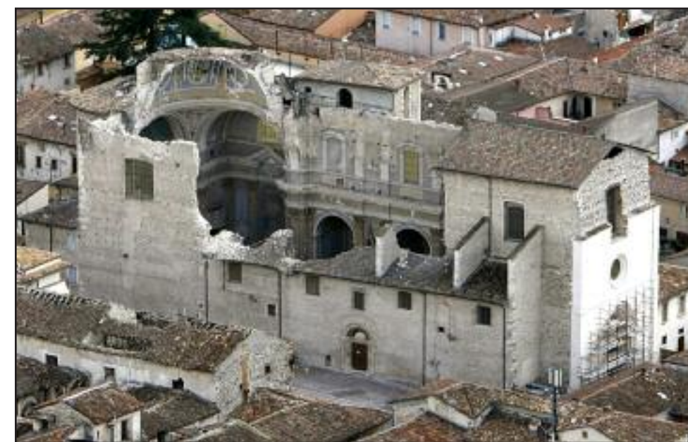
Santa Maria del Suffragio (o delle Anime Sante)