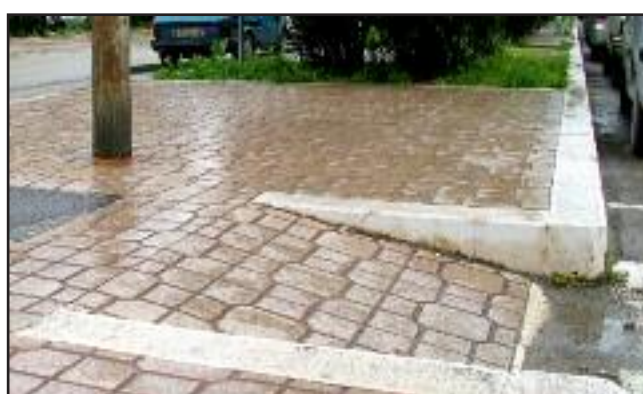
Viale Michelangelo, rampe non conformi per pendenza superiore all'8%

Art. 6. ATTRAVERSAMENTI PEDONALI 3. Le piattaforme salvagente devono essere accessibili alle persone su sedia a ruote.