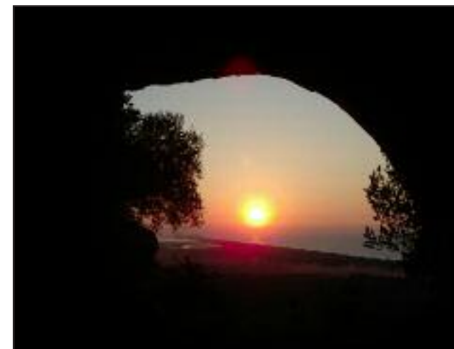
Il tramonto dalla grotta dell'Angelo presso Cagnano Varano