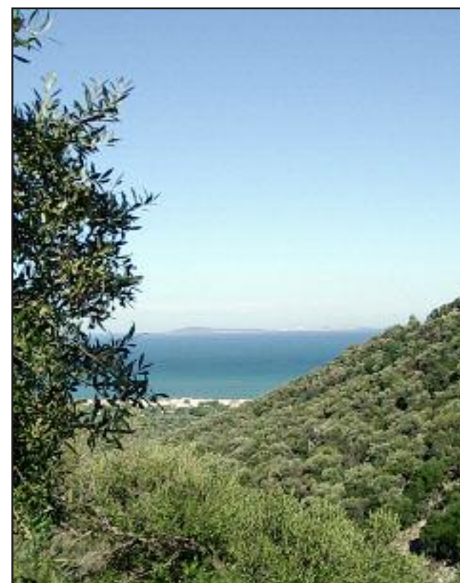
Una suggestiva vista delle isole Tremiti da Monte d'Elio.

Testo e immagini tratte da: Gargano, storia, arte, leggende Enterra, Foggia, 2009