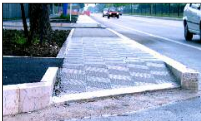
Via Napoli, un'alta marea marciapiedistica di oltre 20 cm