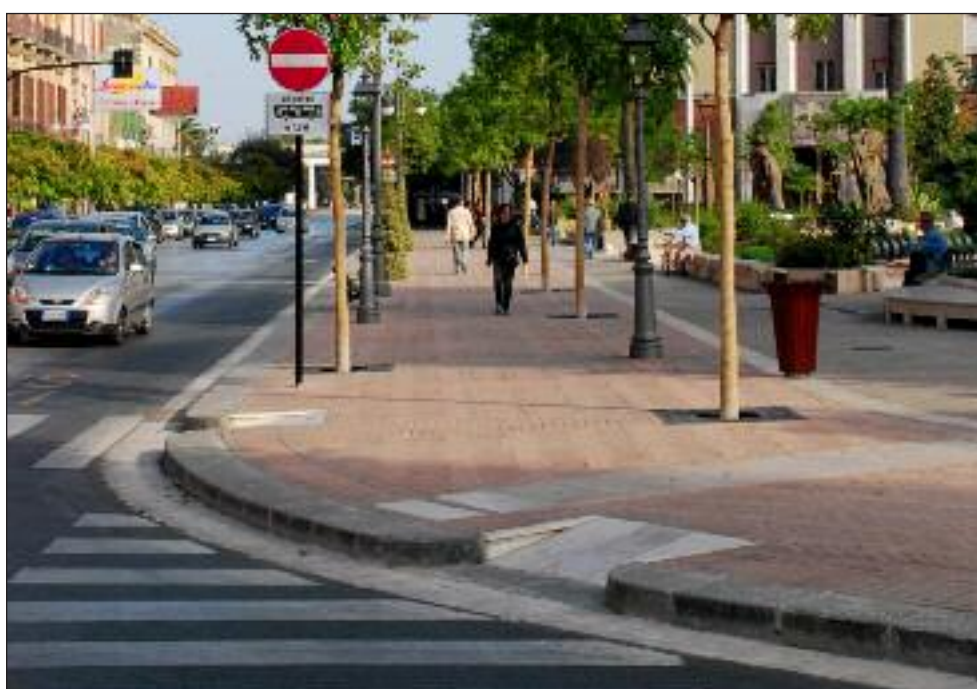
La nuova piazza Giordano, non è fatta per i ciechi. Nessuna attenzione è stata posta alle loro esigenze che non sono state considerate per ignoranza. C'è un'unica realtà: i ciechi qui non potranno metterci piede.

A Foggia le disposizioni di legge sono quasi del tutto ignorate