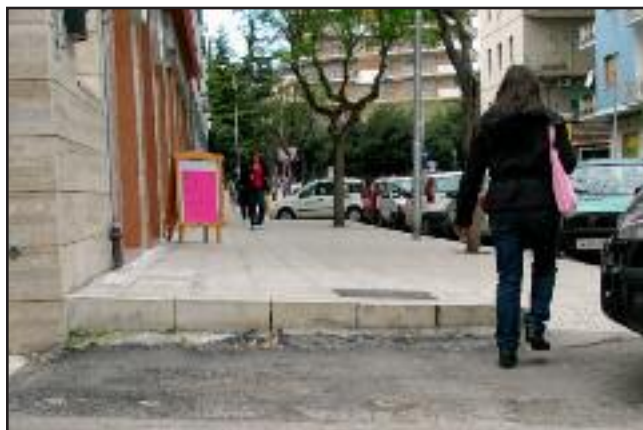
Viale Colombo, un salto di quota che arriva a quasi 30 cm