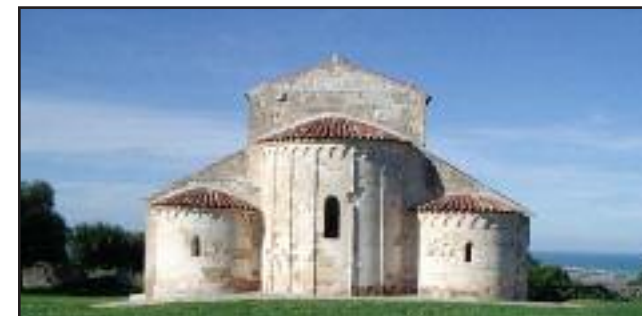
Santa Maria di Monte d'Elio, vista della zona absidale