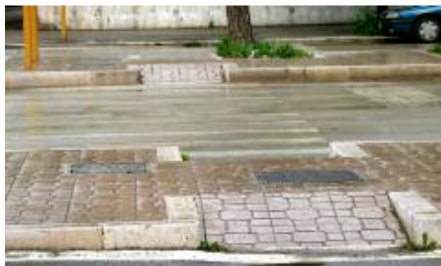
Viale Michelangelo, serie di rampe invalicabili per una carrozzella