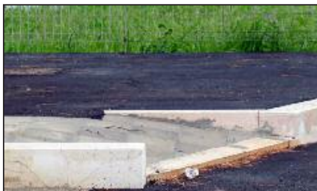
Via Napoli, la rampa cortissima che termina con un gradino. Geniale!