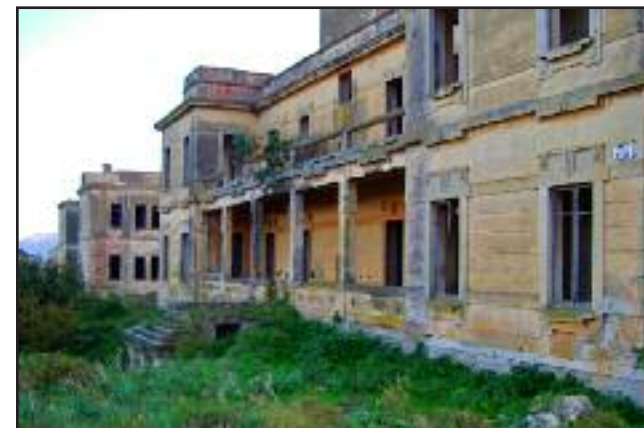
L'ex idroscalo segreto di S. Nicola Imbuto sul lago di Varano