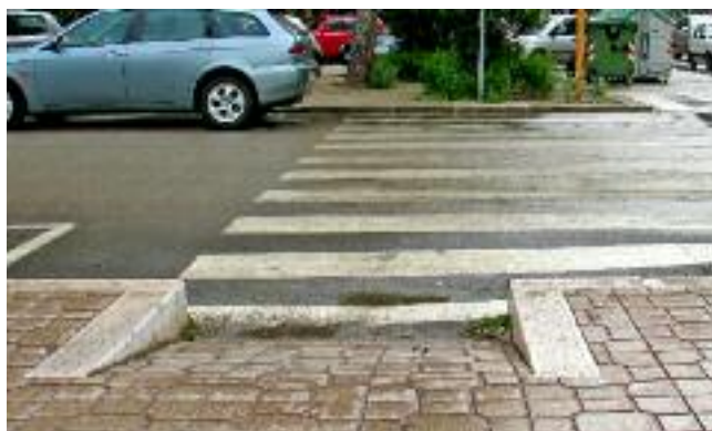
Viale Michelangelo, una rampa scomoda che non va da nessuna parte