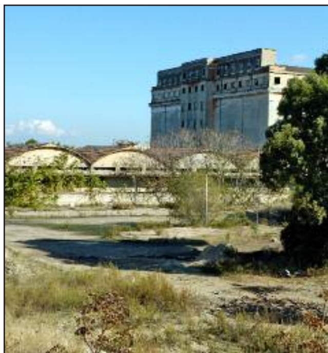
Due esempi del territorio foggiano che da tempo segnano in maniera incisiva il paesaggio e che sono ancora in attesa di destinazione. In alto, il silos granario su via Manfredonia, in basso il campo di calcio della FIGC.

La sezione di Foggia è attiva sul territorio da più di tre decenni con attività di volontariato culturale che hanno lo scopo di contribuire alla diffusione nel Paese della "cultura della conservazione" del paesaggio urbano e rurale, dei monumenti, del carattere ambientale delle città.