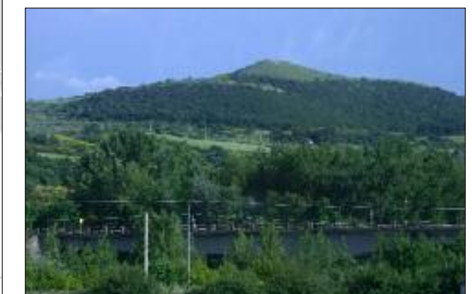
Due esempi di paesaggi eccezionali della nostra Capitanata: in alto il Cervaro, qui sopra il panorama del vallone di Bovino.