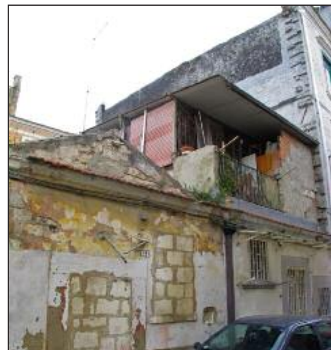
I cosiddetti quartieri settecenteschi: un paesaggio urbano degradato che esiste solo a Foggia e che nel panorama europeo non ha alcun riscontro. Da più di tre secoli occupano una superficie più ampia del centro storico