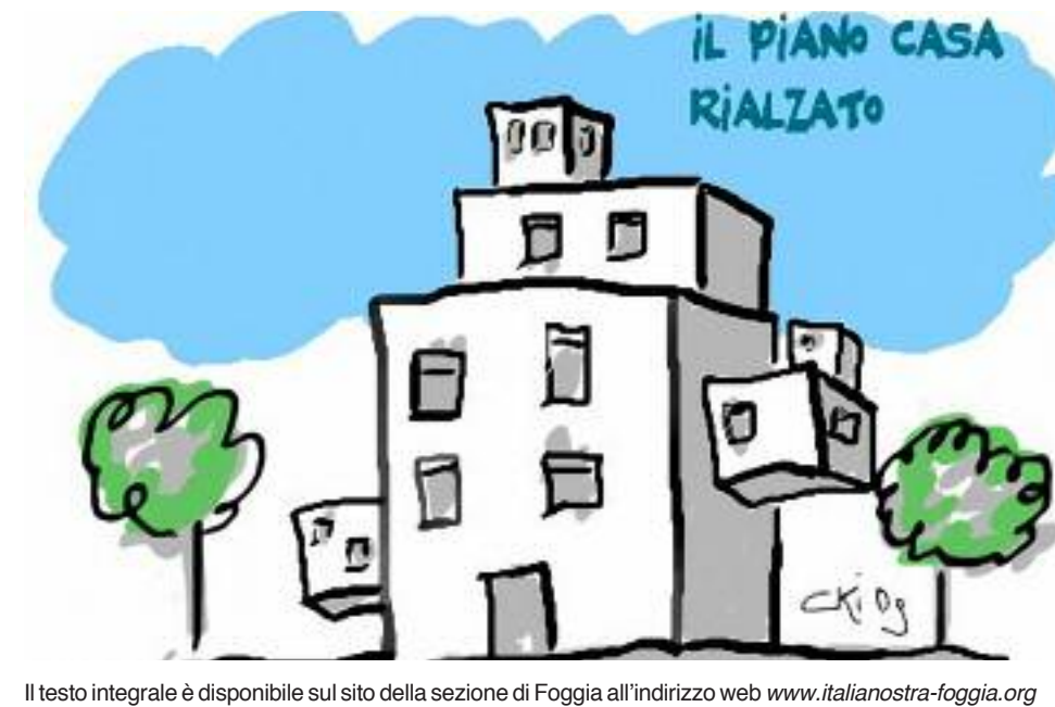
Il testo integrale è disponibile sul sito della sezione di Foggia all'indirizzo web www.italianostra-foggia.org