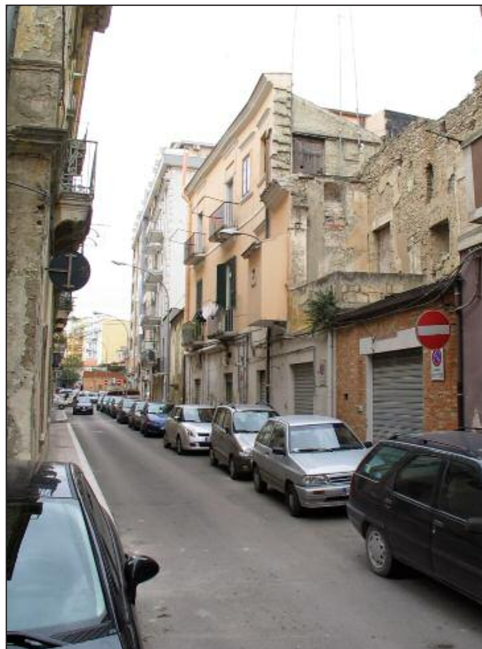
via San Pietro Alcantera